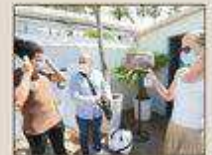
Dès l'entrée, l'hôtesses propose du gel aux clients.

www.cannes.com, il est également transmis en main propre par le service santé et hygiène à la demande des établissements. Gestion du personnel, des fournisseurs, accueil des