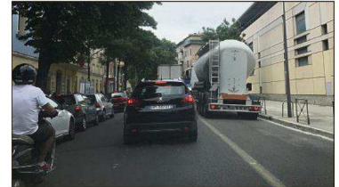
Les plots et la ligne jaune, qui délimitaient la piste cyclable, viennent d'être enlevés sur la voie de droite, rendue aux véhicules à moteur.

Les cyclistes ne devraient pas être pour autant fâchés. La piste cyclable était manifestement très peu empruntée par les vélos.